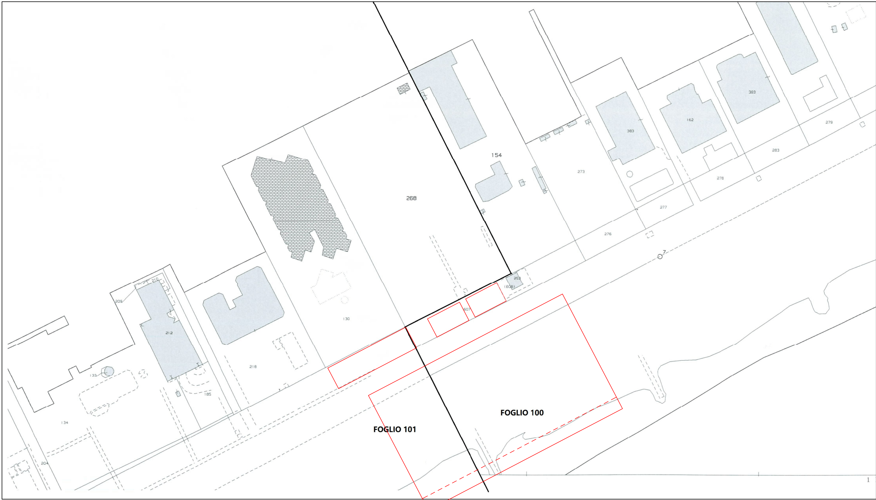
ESTRATTO DI MAPPA SCALA 1:1000 Comune di Jesolo foglio 101 e 100